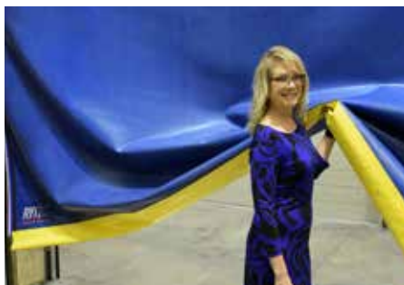
El panel flexible elimina las preocupaciones de atrapamiento.