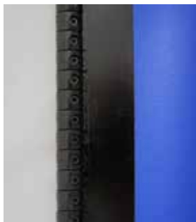
Los dientes de transmisión duraderos permanecen intactos bajo alta presión.

Los modelos FlexTec están disponibles para aberturas de hasta 16 pies de ancho y hasta 20 pies de alto.