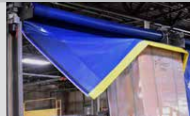
El panel se reajusta si recibe un impacto