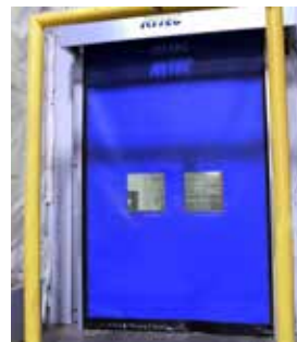
Se muestra con ventanas opcionales