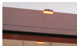
Pathwatch II au-dessus de la porte