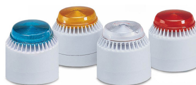
Sonde/phares stroboscopiques à 360°

Généralement utilisé dans des environnements industriels ou des applications où le trafic est plus élevé. Une sélection minutieuse dans les applications avec un grand nombre d'autres lampes de signalisation est nécessaire pour assurer la distinction.