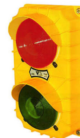
Feu de circulation