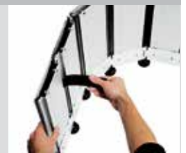
Caoutchouc d'étanchéité intégré