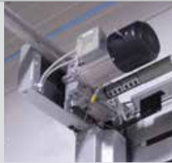
Moteur à vitesse variable