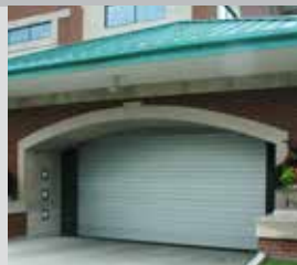
Porte Spiral® à lattes pleines

Tailles maximales standard affichées; dimensions plus grandes disponibles à la demande.