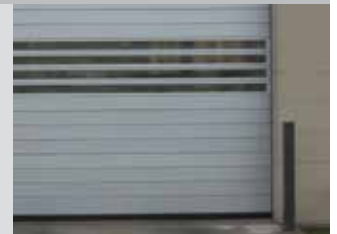
Lattes solides et de vision illustrées