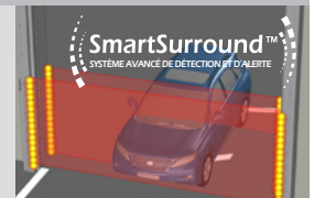
Les rideaux lumineux SmartSurround™ et les bandes lumineuses à DEL assurent la protection du périmètre sur 4 coins.