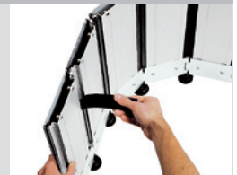
Caoutchouc d'étanchéité intégré