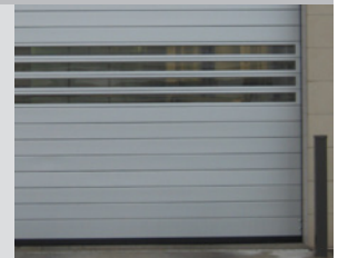
Lattes solides et de vision illustrées