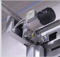
Moteur à vitesse variable