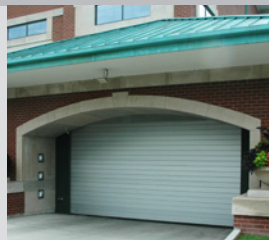
Porte Spiral® à lattes pleines

Tailles maximales standard affichées; dimensions plus grandes disponibles à la demande.