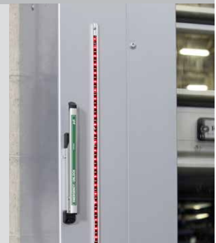
Témoins lumineux d'avertissement Pathwatch et levier de desserrage du frein