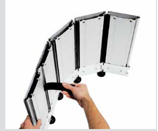
Caoutchouc d'étanchéité intégral