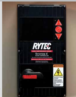
System 4 montré avec débranchement rotatif facultatif

Tailles maximales standards affichées; dimensions plus grandes disponibles à la demande.