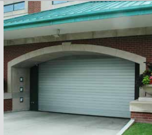
Lattes élégantes de six pouces de hauteur illustrées