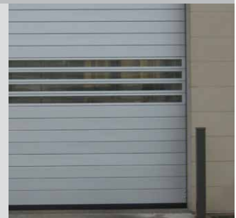
Lattes solides et de vision illustrées