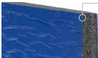
Panel térmico Rylon™

Ideal para aplicaciones en interiores con tráfico no activo donde son factores cruciales la velocidad, el bajo mantenimiento y la confiabilidad para las operaciones cotidianas.