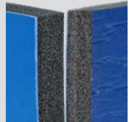
Panel térmico Rylon (3.0)