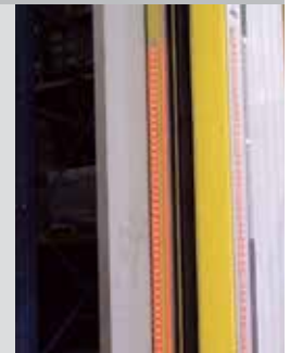
Système d'éclairage de sécurité Pathwatch