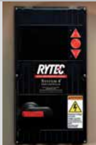
System 4 montré avec débranchement rotatif facultatif

Tailles maximales standard indiquées ; consulter l'usine pour d'autres tailles.