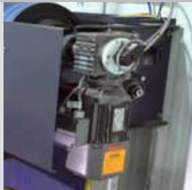
Moteur à entraînement direct