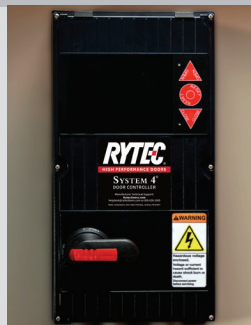
System 4 montré avec débranchement rotatif facultatif

Tailles maximales standards affichées; dimensions plus grandes disponibles à la demande.