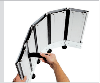
Caoutchouc d'étanchéité intégral