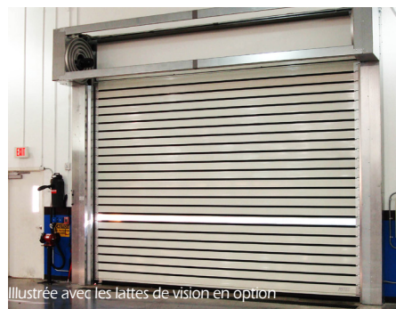
Illustrée avec les lattes de vision en option