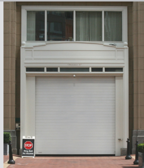
Lattes de six pouces de hauteur illustrées.