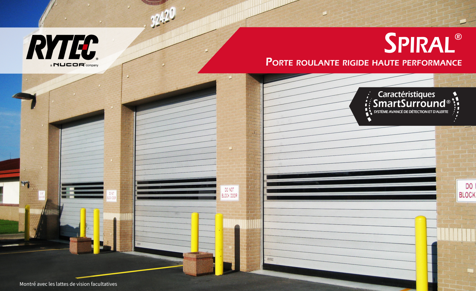
Montré avec les lattes de vision facultatives