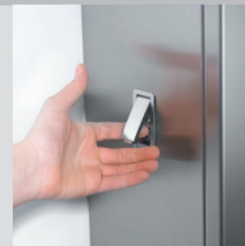
Dégagement manuel encastré