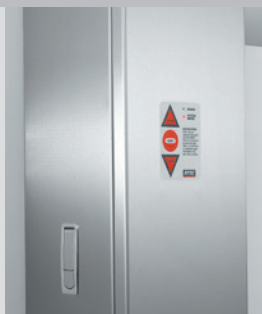
L'interrupteur tactile encastré permet le montage à distance des commandes.