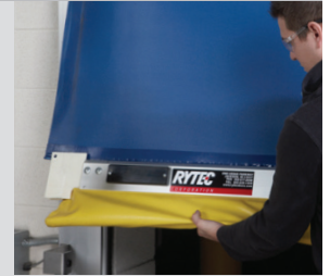
Languettes Quick-Set pour dégagement sans dommages