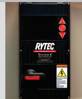
Se ilustra el System 4 con desconexión giratoria opcional