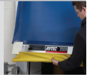
Lengüetas Quick-Set para liberación sin daños