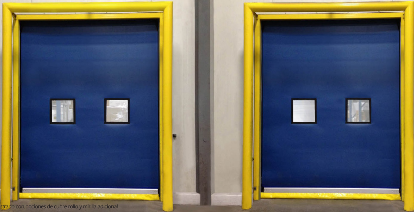
Mostrado con opciones de cubrir rollo y mirilla adicional