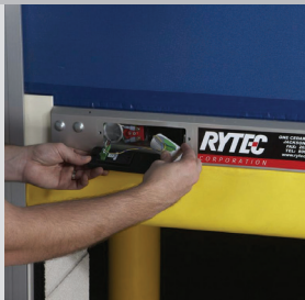
El modo de inactividad automático prolonga la vida útil de la batería