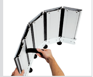
Caoutchouc d'étanchéité intégral