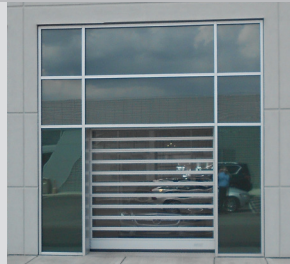
Lattes de vision de neuf pouces de haut pour une meilleure visibilité