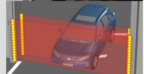
Les rideaux lumineux SmartSurround® et les bandes lumineuses à DEL assurent la protection du périmètre sur 4 coins.