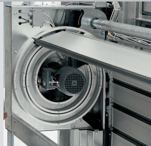
Moteur d'entraînement CA