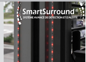
SmartSurround® SYSTÈME AVANCÉ DE DÉTECTION ET D'ALERTE