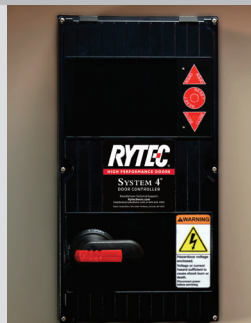
System 4 montré avec débranchement rotatif facultatif

Tailles maximales standards affichées; dimensions plus grandes disponibles à la demande.